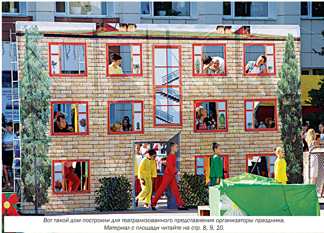
Вот такой дом построили для театрализованного представления организаторы праздника. Материал с площади читайте на стр. 8, 9, 10.

– Это мой любимый город, где я родился и вырос. Мне нравится, что здесь живут отзывчивые добрые люди. После службы в армии поступил в Валуйский индустриальный техникум, учусь на первом курсе, получаю профессию автомеханика.