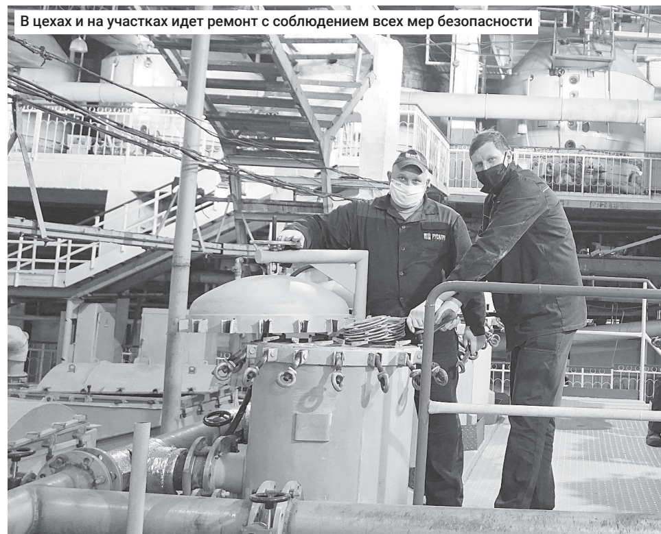
В цехах и на участках идет ремонт с соблюдением всех мер безопасности

Сотрудники предприятия уверены, что даже в сложившейся ситуации справятся со всеми трудностями и завод будет подготовлен к запуску в установленный срок, а сезон сложится не хуже прошлогоднего.