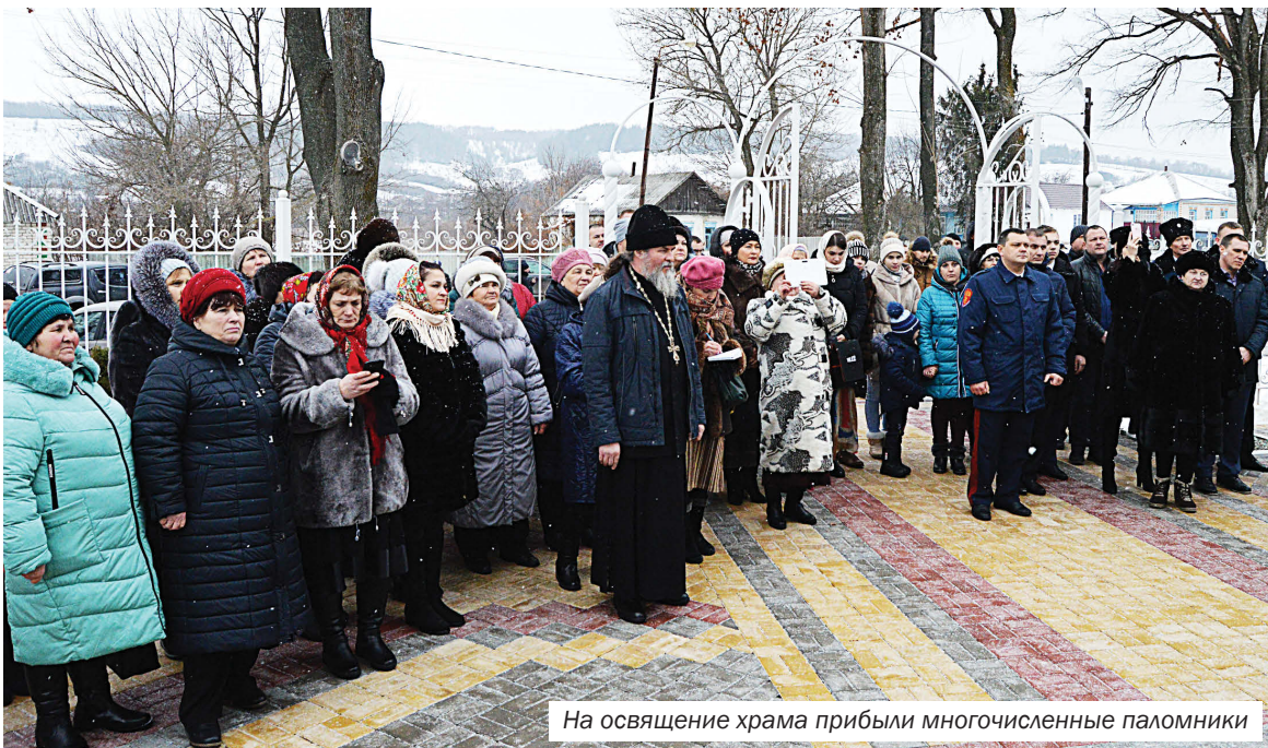
На освящение храма прибыли многочисленные паломники