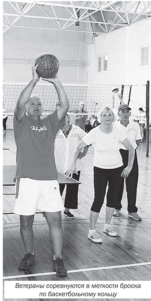
Ветераны соревнуются в меткости броска по баскетбольному кольцу