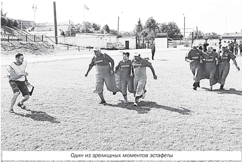
Один из зрелищных моментов эстафеты

В общекомандном зачете первое место заняли ветераны из Уразово, второе место поделили спортсмены из Валук и Шелаево, третьей стала команда из Двудучного.