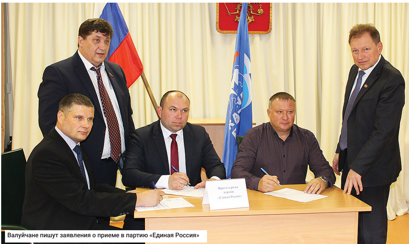
Валуйчане пишут заявления о приеме в партию «Единая Россия»

zvezda-valujskaya@yandex.ru ok.ru/valujskay vk.com/val.zvezda facebook.com/zvezda.valuiki valuiskaiazvezda